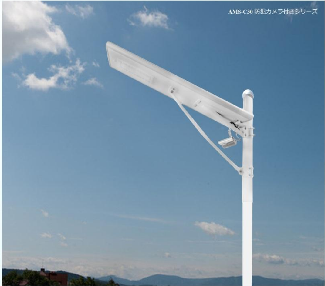
AMS-C30 防犯カメラ付きシリーズ

装飾灯付き： 交通安全の為、ドライバーや歩行者に、道路を示す役割があります。装飾の外に交通事故を避けるために、商品設計しました。